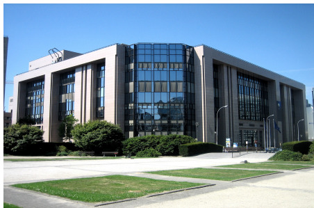
Rada Evropské unie v Bruselu