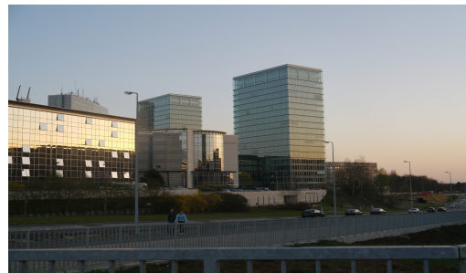
Instituce EU v Lucemburku