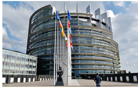
Evropský parlament ve Štrasburku