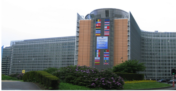
Sídlem Evropské komise je budova Berlaymont v Bruselu