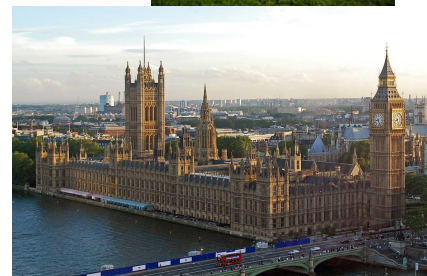
Westminsterský palác a Big Ben