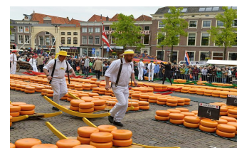
tradiční sýrový trh