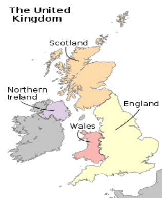
země Spojeného království