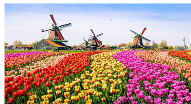
tulipány a větrné mlýny