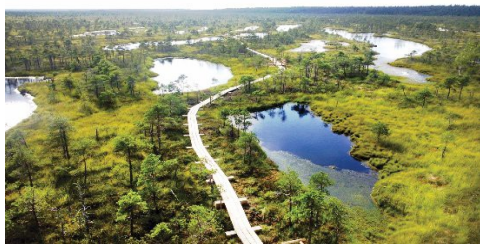
Národní park Kemeris