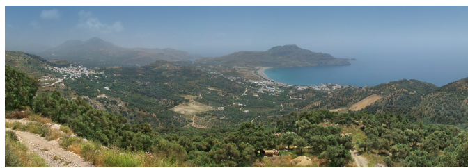
jižní pobřeží Kréty