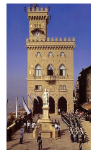
Palazzo Pubblico - sídlo vlády San Marina