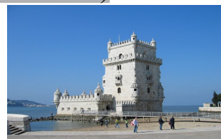
Belémská věž - Lisabon