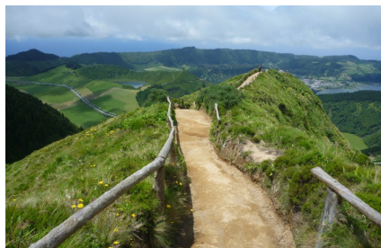
Azorské ostrovy -->Portugalsko