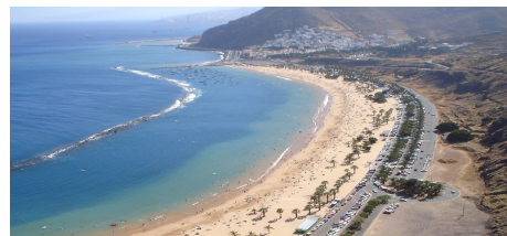
turistická pláž na ostrově Tenerife