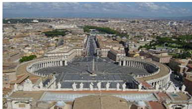
náměstí sv. Petra ve Vatikánu