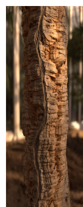
borka před sloupnutím