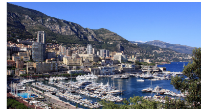
Monte Carlo v Monaku