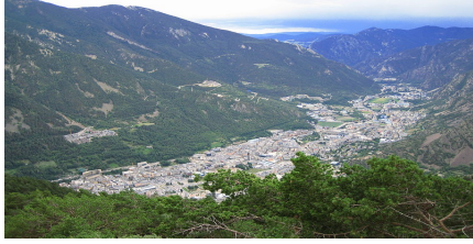
pohled na hlavní město Andorry