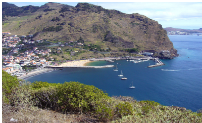
zátoka Machico na ostrově Madeira