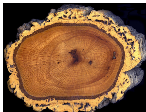
průřez kmenem korkového dubu