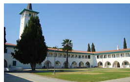
Kyperská univerzita v Nikósii