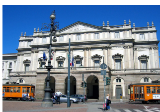
La Scala v Miláně