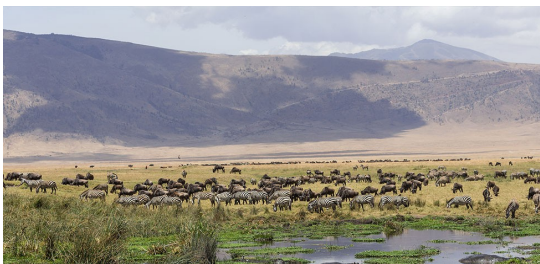
kráter Ngorongoro - největší neporušená sopečná kaldera na světě