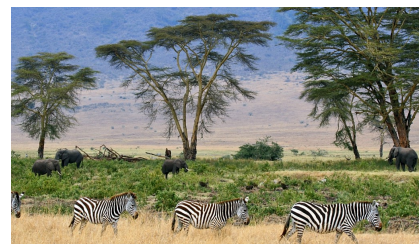
pláně NP Serengeti