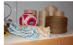
výrobky ze sisalu