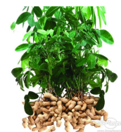
podzemnice olejná (buráky)

– díky vývozu ropy, kaučuku, kaka a podzemnice olejné se řadí mezi nejbohatší africké země