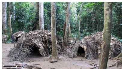
pralesní vesnice Pygmejů