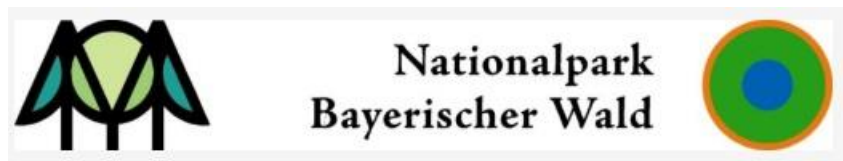
Národní park Bavorský les