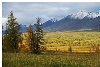
Národní park Jugyd Va