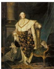
Francouzský král Ludvík XVI.