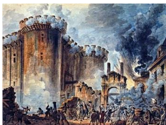
Pád Bastily 14. července 1789