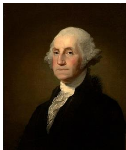
G. Washington – první prezident USA