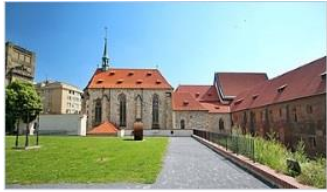
Anežský klášter v Praze