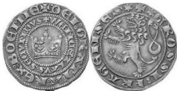
Pražský groš, zdroj: https://cs.wikipedia.org/wiki/Pra%C5%B8esk%C3%BD_gro%C5%A1