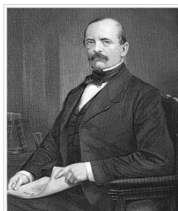
Otto von Bismarck