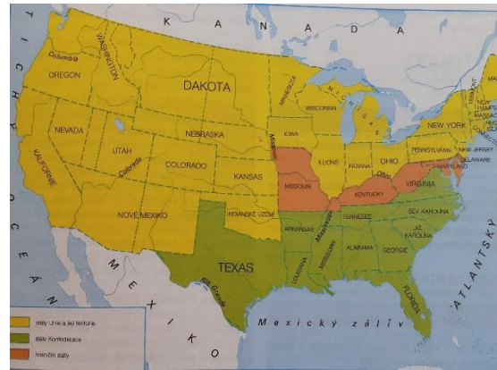
Mapa Unie a Konfederace