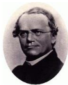
Johann Gregor Mendel