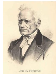
Jan Evangelista Purkyně