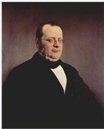
Sardinský premiér Camillo Benso hrabě di Cavour