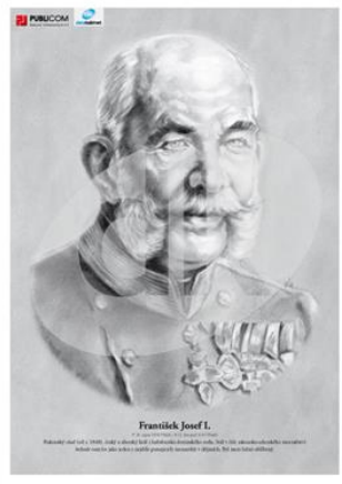
František Josef I. (1848-1916)