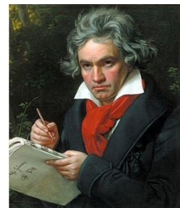
L. van Beethoven