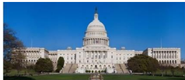
Kapitol ve Washingtonu