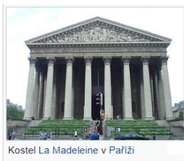
Kostel La Madeleine v Paříži