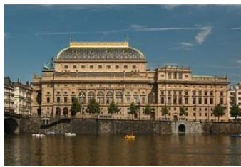
Národní divadlo v Praze