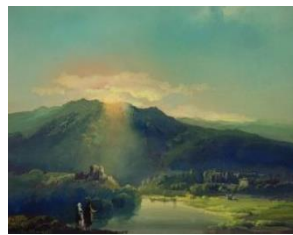
Josef Navrátil: Západ slunce