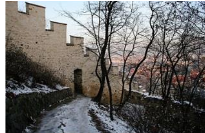
Hladová zed' v Praze