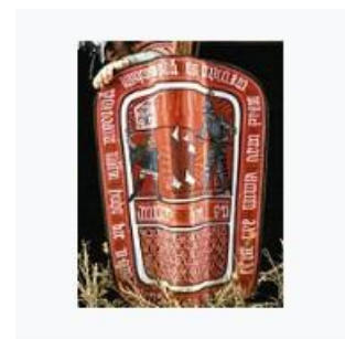
Pavéza – husitský štít