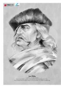
Jan Žižka z Trocnova