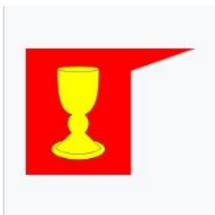
Kalich – symbol husitů