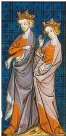
Anglický král Jindřich II. a Eleonora Akvitánská