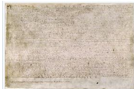
Velká listina svobod vydaná roku 1215