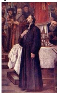
Jan Hus v Kostnici