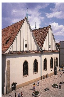
Betlémská kaple v Praze