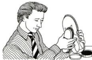
He is cleaning his shoes.