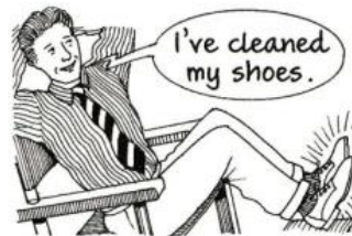
He has cleaned his shoes. (= his shoes are clean now )

They have gone out. Z domu již vyšli a ten zůstal prázdný. Následek jejich odchodu je tedy v přítomnosti patrný.