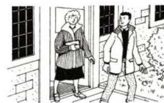
They are going out.