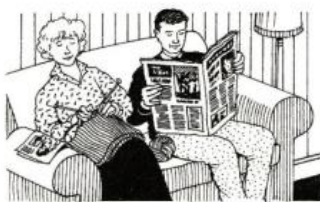
They are at home.

They have gone out. Z domu již vyšli a ten zůstal prázdný. Následek jejich odchodu je tedy v přítomnosti patrný.