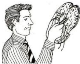
His shoes are dirty.

Děj (čištění bot) začal v minulosti, ale výsledek (to, že má boty čisté) je přítomnost.